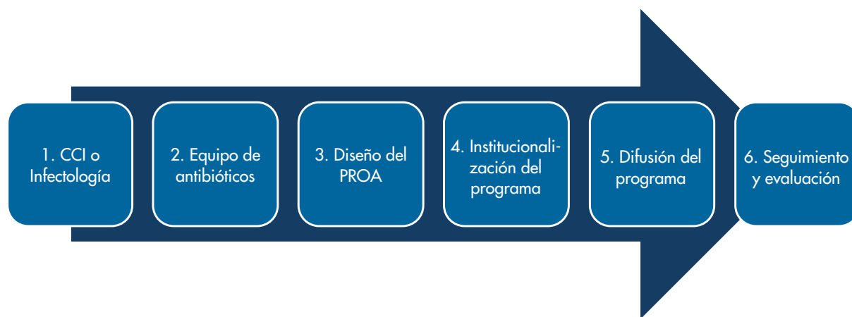
Figura 1. Aspectos organizativos para la implementación de un PROA

El programa puede organizarse en fases, las cuales deben ser adaptadas en cada institución, con el fin de seguir un orden lógico y unificado, que garantice los resultados esperados y la sostenibilidad, como podemos ver en la Figura 1.